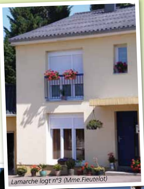
Lamarche logt n°3 (Mme.Fieutelot)