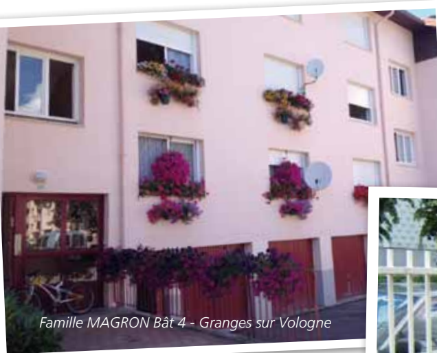
Famille MAGRON Bât 4 - Granges sur Vologne