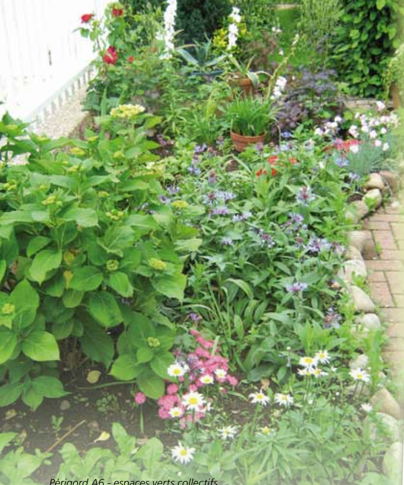
Périgord A6 - espaces verts collectifs