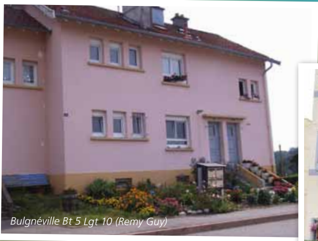
Bulgnéville Bt 5 Lgt 10 (Remy Guy)