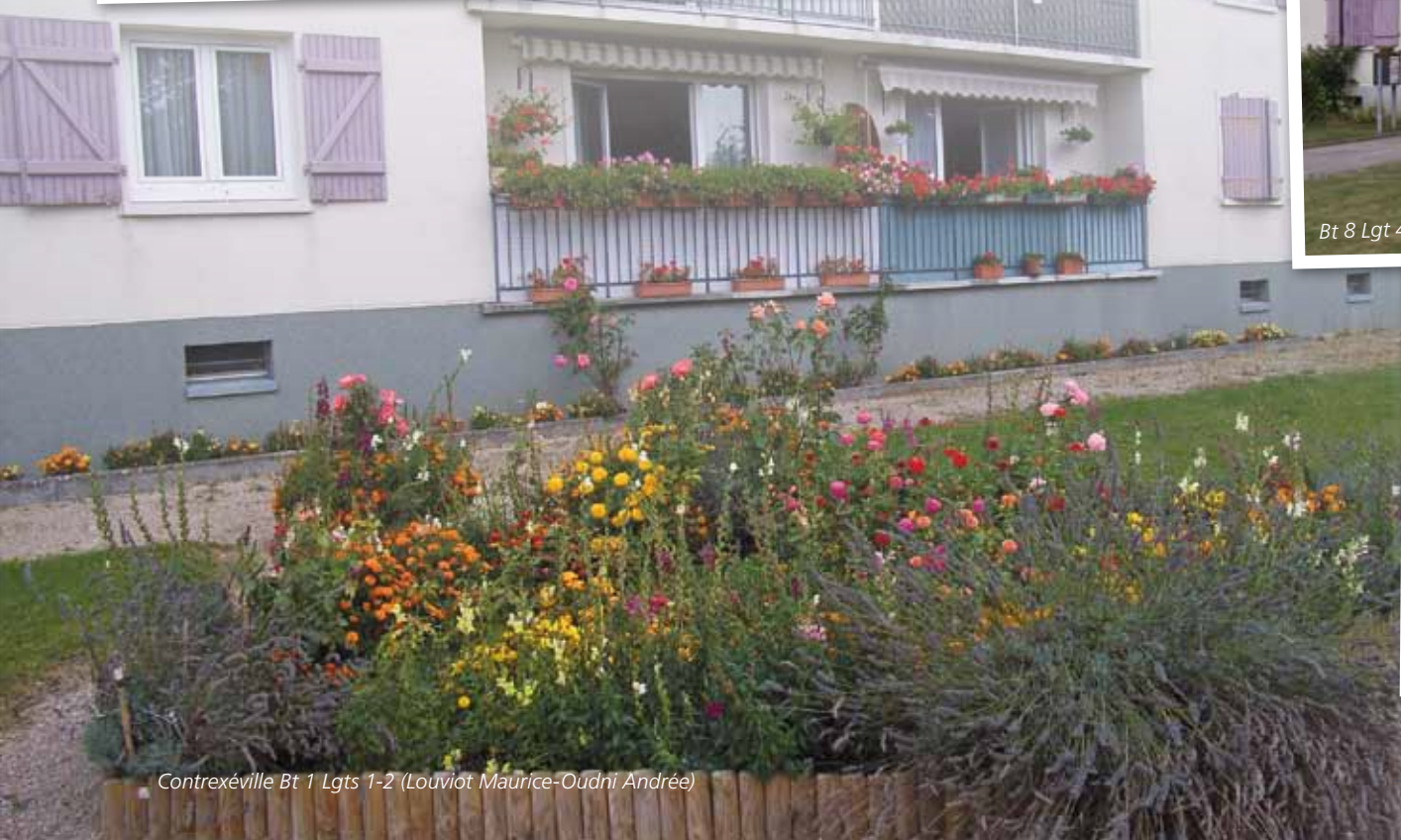
Contrexéville Bt 1 Lgts 1-2 (Louviot Maurice-Oudni Andrée)