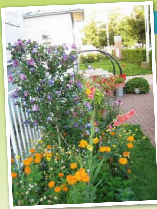
Kellerman août 2012 Périgord A8 Fabiani