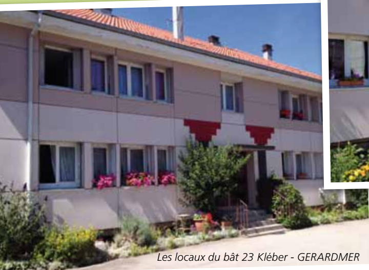
Les locaux du bât 23 Kléber - GERARDMER