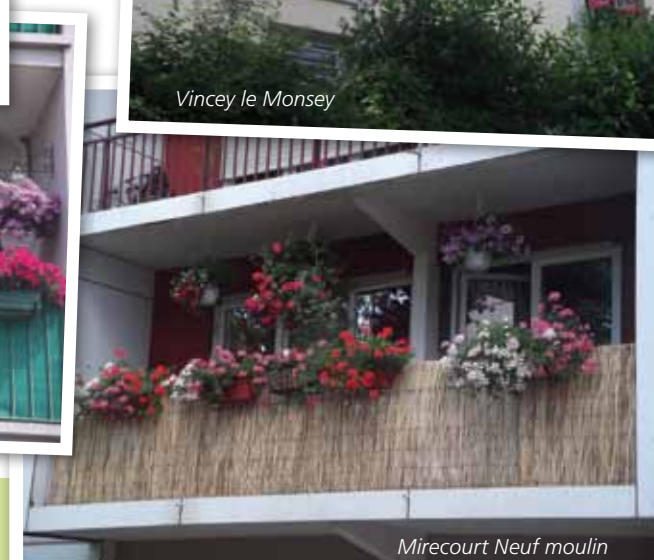
Mirecourt Neuf moulin