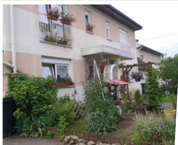
Bains les Bains