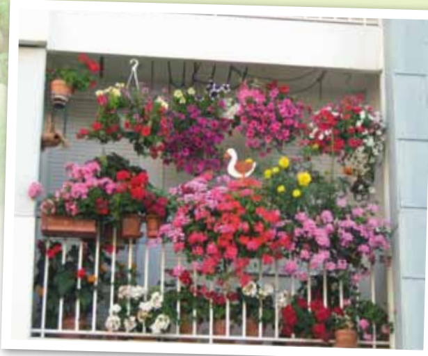
Kellerman août 2012 balcon Fabiani logt 151 Périgord A8