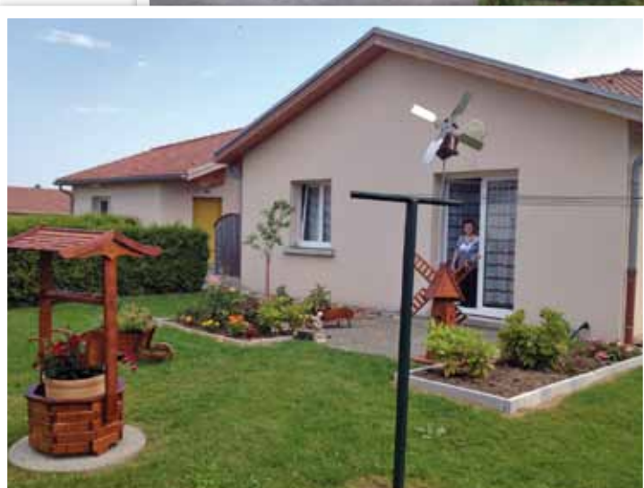
Georgel Nicolle 4C les Voyaux - Corcieux