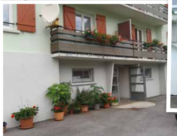
Le Val d'Ajol