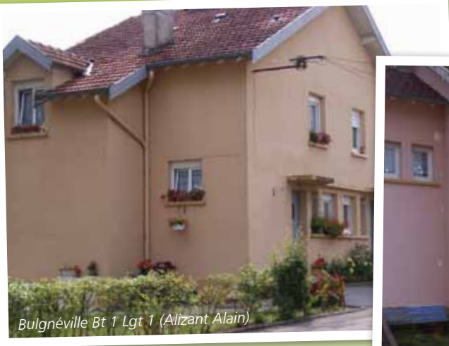
Bulgnéville Bt 1 Lgt 1 (Alizant Alain)