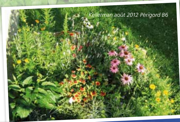
Kellerman août 2012 Périgord B6