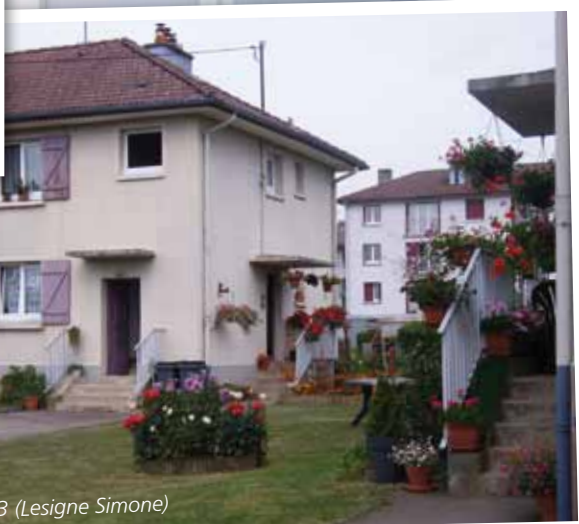
Bt 8 Lgt 43 (Lesigne Simone)