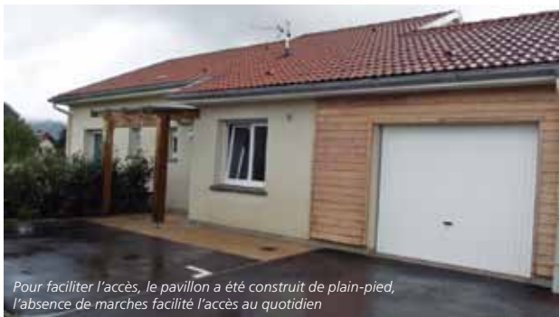
Pour faciliter l'accès, le pavillon a été construit de plain-pied, l'absence de marches facilite l'accès au quotidien