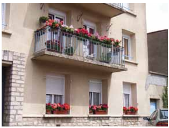
Neufchâteau - rue Verdunoise