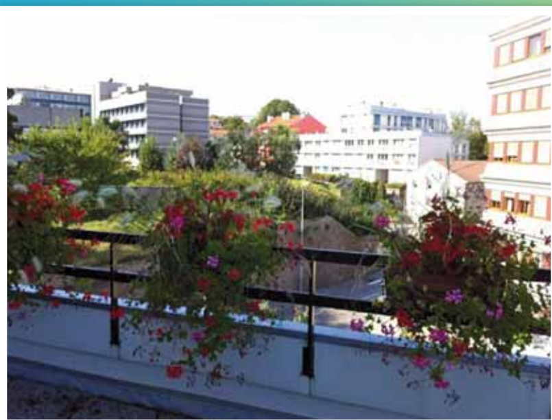
Epinal Quai Barbier