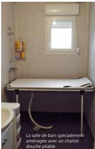
La salle de bain spécialement aménagée avec un chariot douche pliable

« Une chose est sûre, nous avons gagné en confort de vie, c'est un soulagement. Notre vie entière a changé. Aujourd'hui, nous pouvons profiter ensemble de la terrasse, de l'extérieur de la maison, et grâce à ces aménagements, nous pouvons prendre bien soin de notre fils, confient-ils ». Un pas en avant important pour cette famille qui se bat au quotidien contre le handicap.