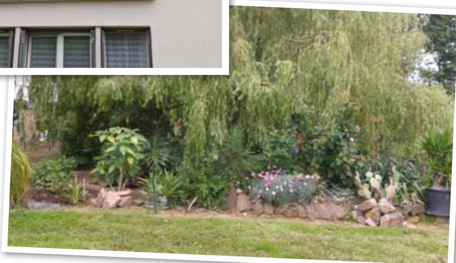
Xertigny Bas des Champs